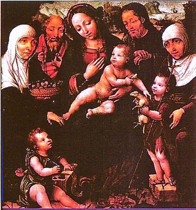
Heilige Familie, dem flämischen Maler Bernart van Orley, einem Schüler Raphaels, zugeschrieben