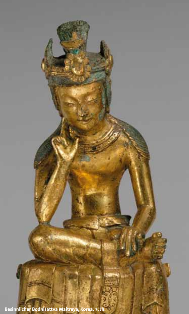
Besinnlicher Bodhisattva Maitreya, Korea, 7. Jh.

Sonntag, 8. Februar 2015, 10.00 bis 17.00 Uhr